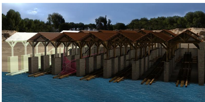
Restitution 3D du bâtiment des néoria de Kition-Bamboula (R. Fabro)

chef de la mission archéologique française de Kition, chercheuse à la Maison de l'Orient et de la Méditerranée (France)